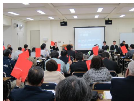
受講者も参加のパネルディスカッション

3 月末時点で兵庫県下の長期優良住宅認定数の実績は、全国 7 位 11,532 棟。1 位の 23,984 棟の愛知県、2 位~5 位は首都圏、6 位の静岡県が先進地域といえます。兵庫県主催の昨年 11 月のセミナーに続き今回の工務店経営者による長期優良住宅への取り組みの情報発信は、仲間の工務店様には具体的で貴重な内容と好評を頂きました。